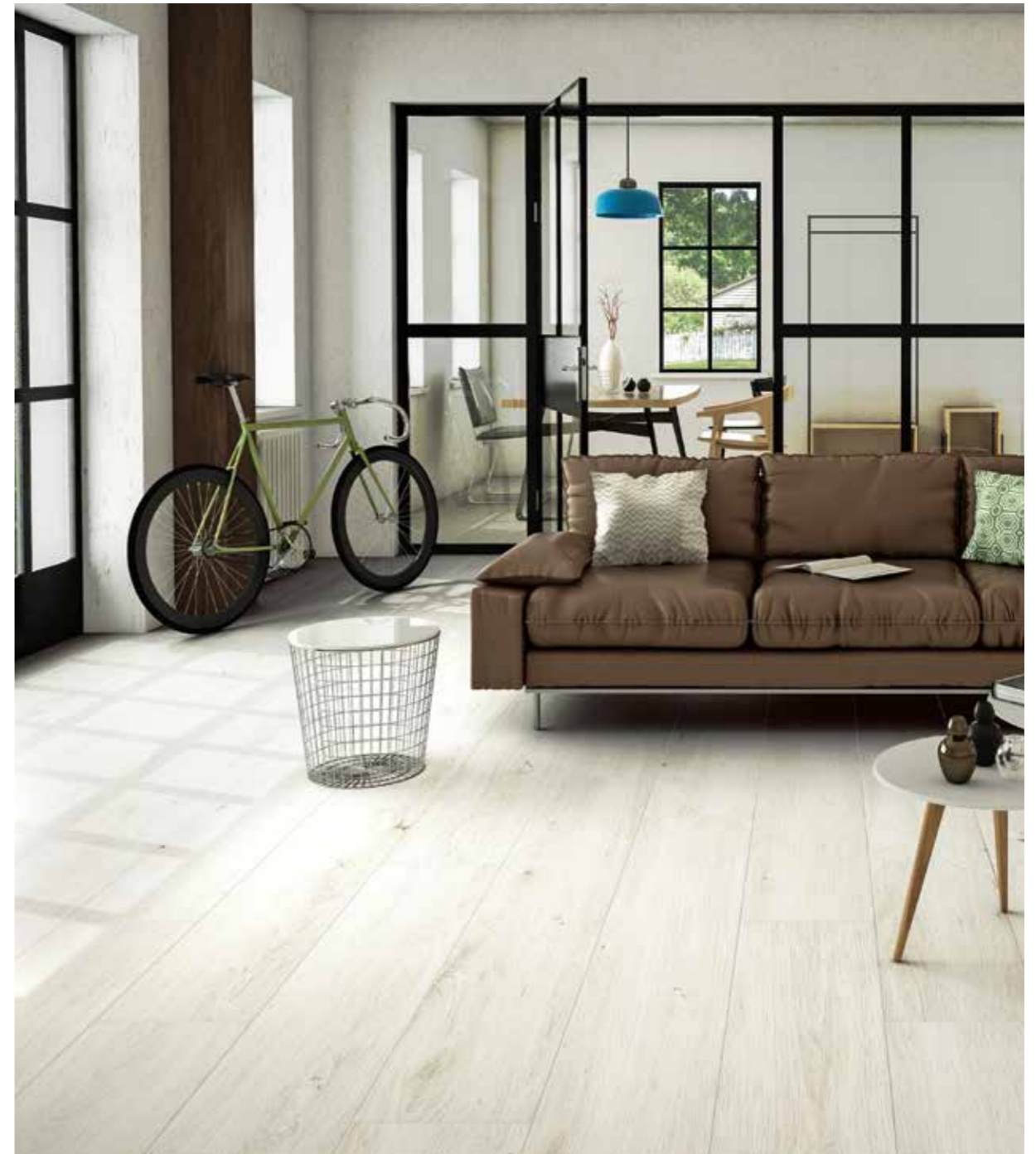
WHITE | 26,0x160,0 cm R_10"x63" R