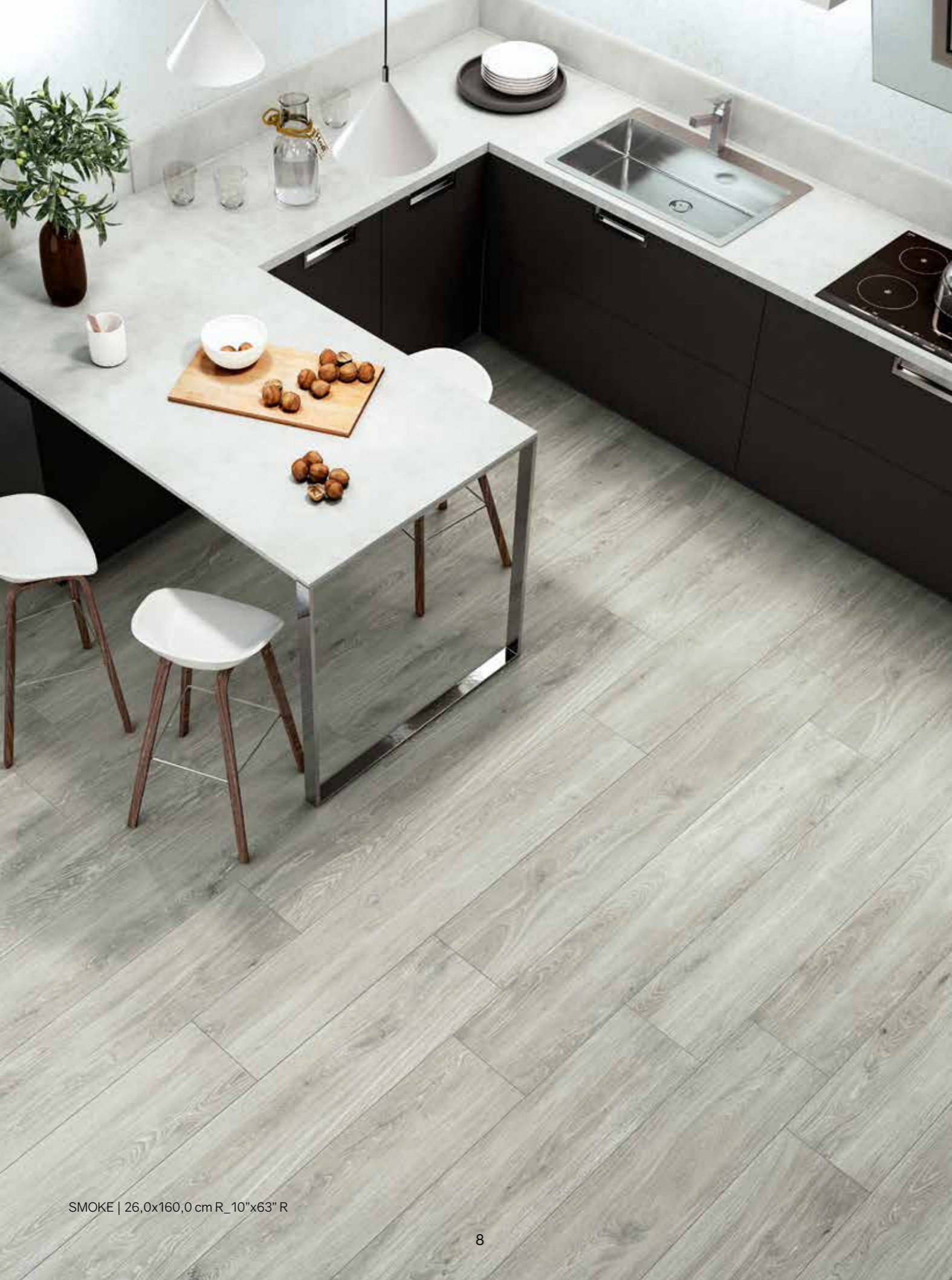
SMOKE | 26,0x160,0 cm R_10"x63" R