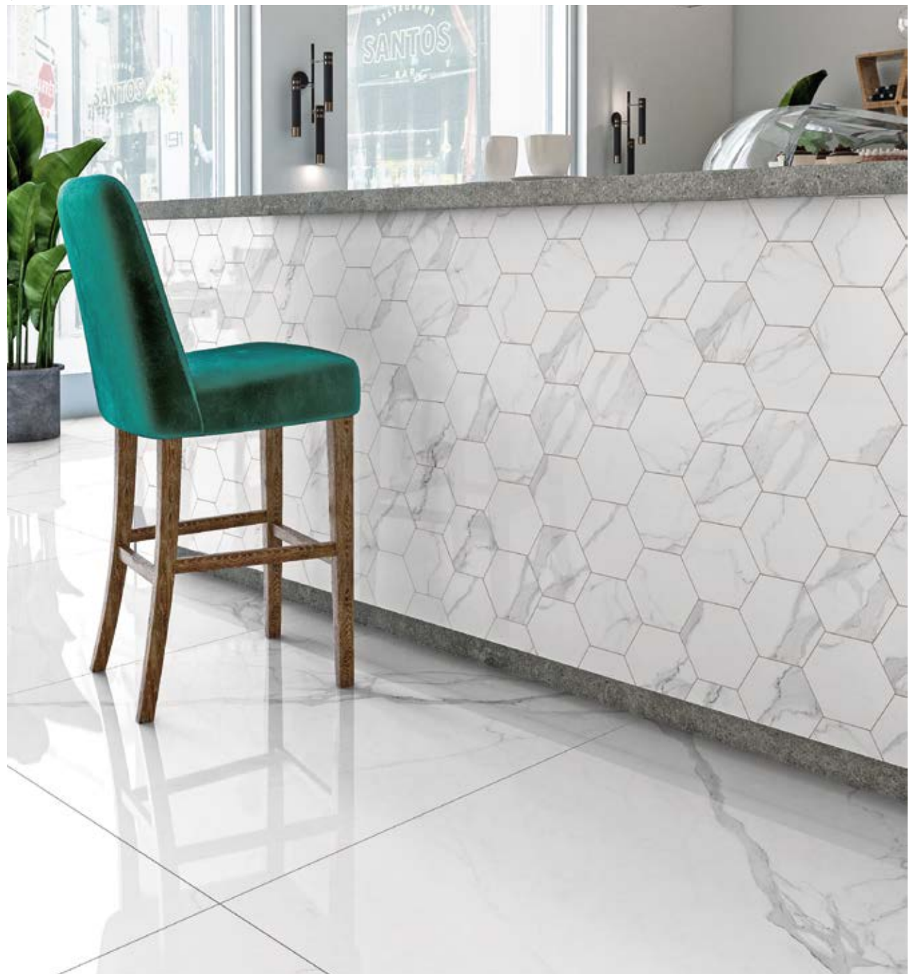
e/ floor: STATUARIO LR - 121x121 cm /48"x48" wall: STATUARIO mosaico esagona L - 30x30 cm/12"x12"